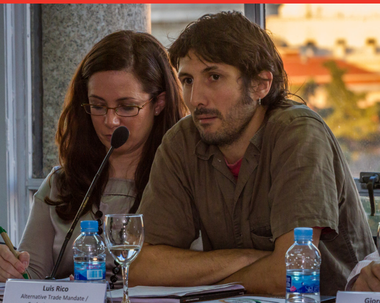
Representantes de CEJ y Ecologistas en Acción presentan la jornada de debate