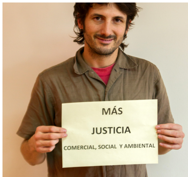
Asistentes a la jornada de debate

de casi un 70% de todas las ventas mundiales, con una facturación de casi 5.000 millones de euros en 2012 y un incremento interanual del 21%. En toda Europa se contabilizan actualmente más de 500 importadoras, 4.000 tiendas y 100.000 voluntarios que hacen posible otra forma de comercio y consumo cuyo impacto positivo reciben 2,5 millones de productores en 70 países del Sur. Y sin embargo, las ventas de productos de Comercio Justo apenas representan el 0,1% de todo el comercio mundial.