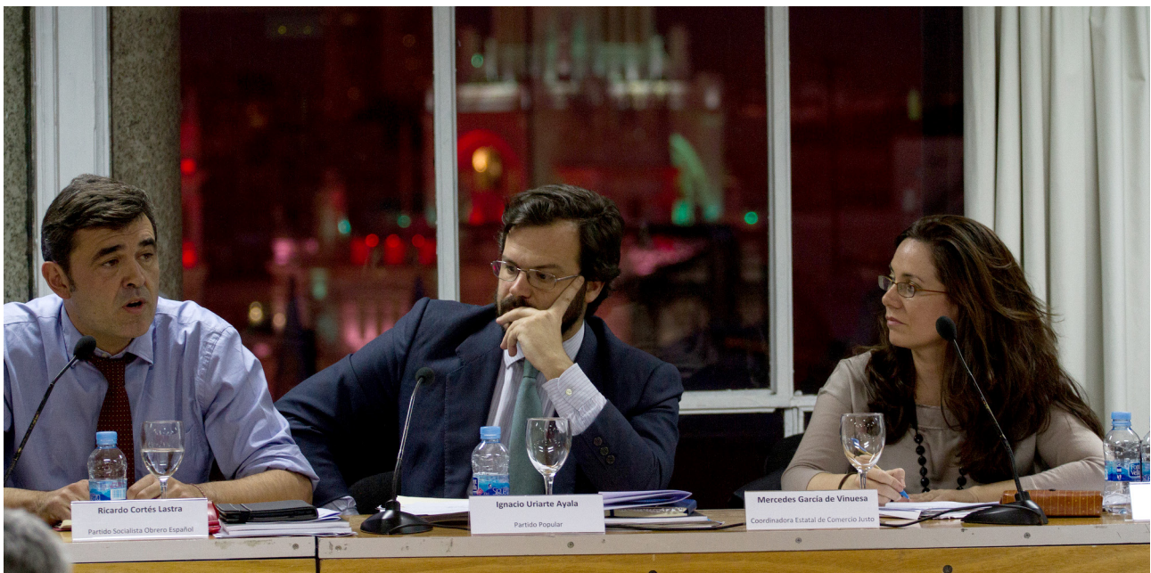
Representantes de PSOE, PP y CEJ durante la jornada de debate

Así pues, transparencia, justicia y coherencia fueron las demandas más repetidas en las distintas intervenciones. El tiempo dirá si este primer paso inauguró un canal de diálogo entre organizaciones sociales y representantes políticos, y si las reivindicaciones de las primeras terminaron llegando a las esferas europeas e incidiendo en las políticas y leyes que determinan nuestras vidas y la de las personas con las que compartimos el planeta. ●