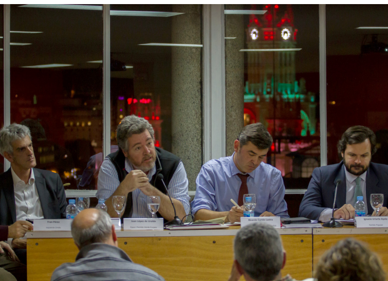
Representantes de UPyD, Equo, PSOE y PP durante la jornada de debate