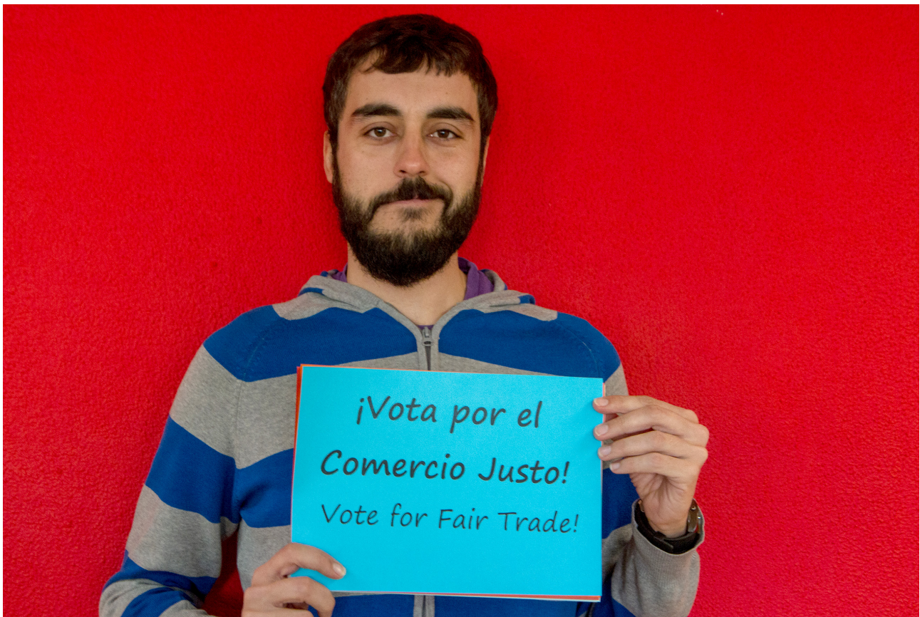
Asistente a la jornada de debate

En consecuencia, la oferta y demanda de productos de Comercio Justo, así como sus impactos positivos en origen y destino, no han dejado de crecer en los últimos años en todo el mundo. Los países de la UE conforman el principal mercado para estos productos: son el destino