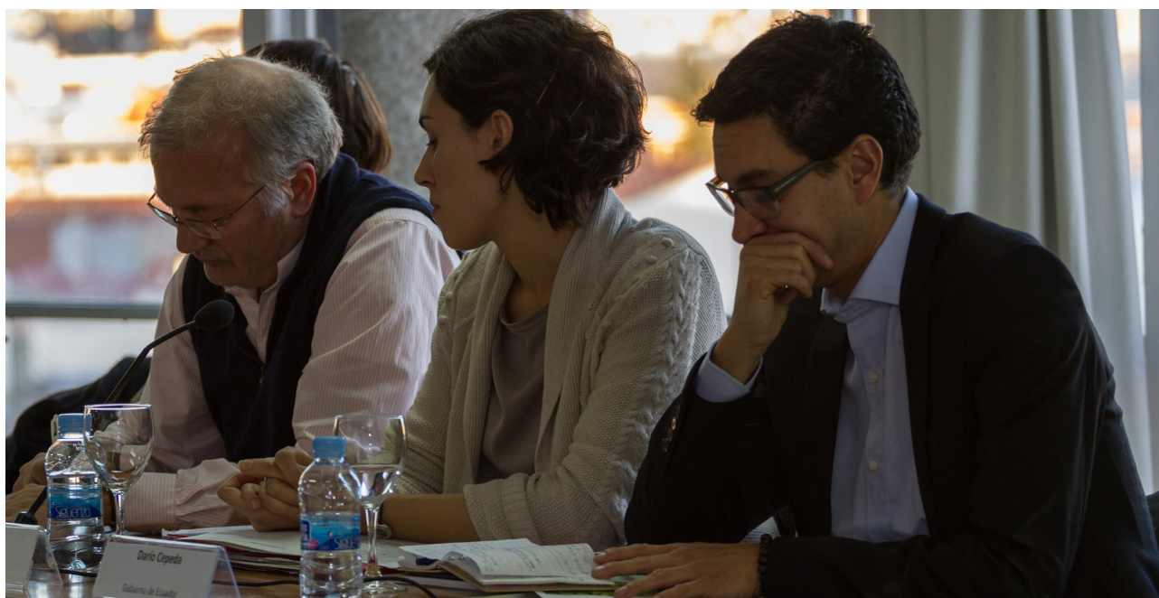
Representantes de WFTO-Europe, FTAO y Proecuador durante el turno de intervenciones