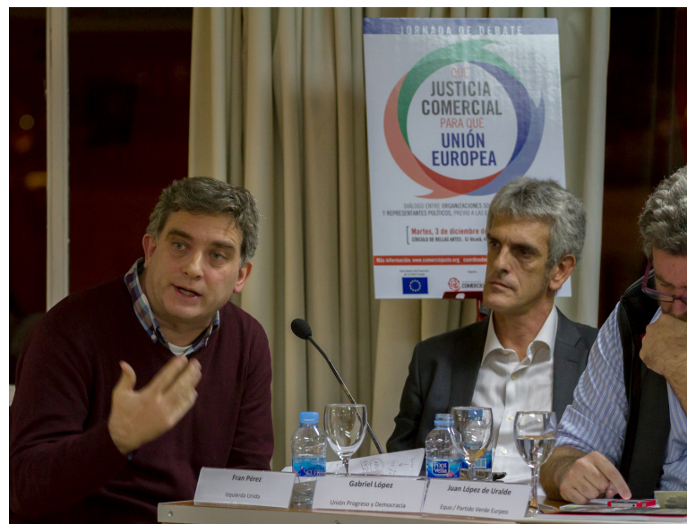
Representantes de IU, UPyD y Equo en un momento del debate

La Coordinadora de Organizaciones de Agricultores y Ganaderos, COAG, trasladó las denuncias que el movimiento internacional Vía Campesina hace de la política comercial europea al impulsar un modelo de agro-negocio especulativo que destruye la agricultura campesina tanto en Europa como en el Sur. El doble rasero comercial de la UE es en realidad una doble trampa para las y los agricultores europeos, ya que el dumping provocado por las subvenciones comunitarias genera un mercado irreal y especulativo por una parte y, por la otra, es fuente de una peligrosa dependencia dado que la eventual eliminación de estas ayudas hundiría el campo europeo.