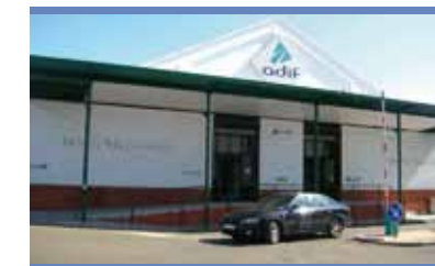
Valladolid Campo Grande

Colaboramos con: Iniciativa propia de Adif