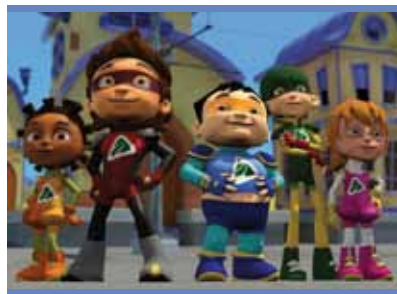
"La estación tiene la clave"