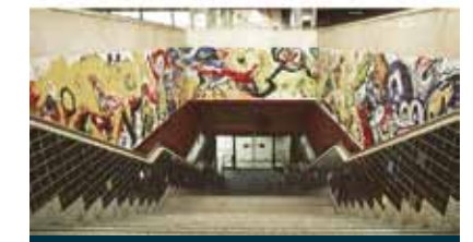
"El espejo de un viaje infinito"